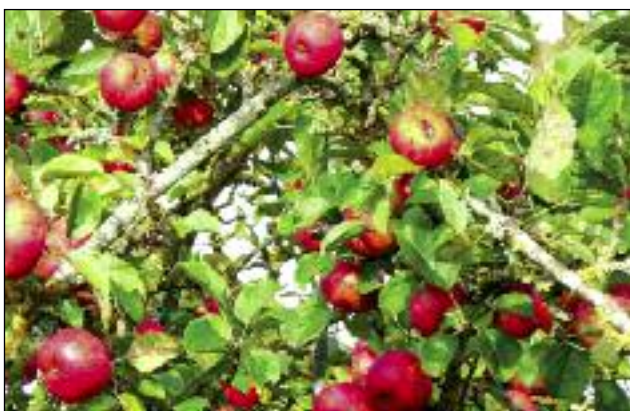
Des contraintes liées au marketing entraînent la disparition des espèces qui ne répondent pas aux "bons" critères...

http://croqueursdepommes10.over-blog.com