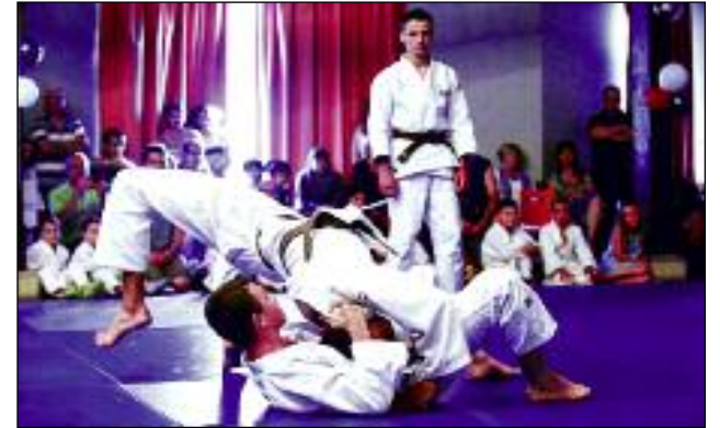
« On ne juge pas un homme au nombre de fois où il tombe, mais au nombre de fois où il se relève. » Jigoro Kano

« Le judo a deux aspects : c'est un sport, et c'est un art martial. Les deux se complètent. » Fondé par Jigoro Kano en 1882 à partir d'un art martial appelé jujitsu , le