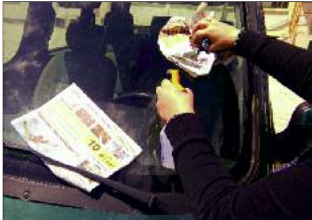
Pour nettoyer vitres, pare-brises et miroirs, un peu d'eau et du papier journal : recyclez vos anciens 10 de Cœur !