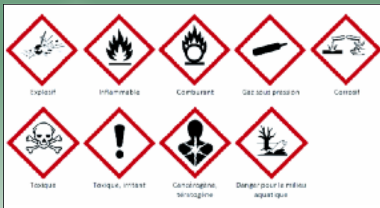
Les pictogrammes ont évolué, mais ils ne suffisent pas. La composition précise des nettoyants industriels réserve bien des surprises. Pour la consulter, se munir d'une loupe ou faire une recherche sur internet.