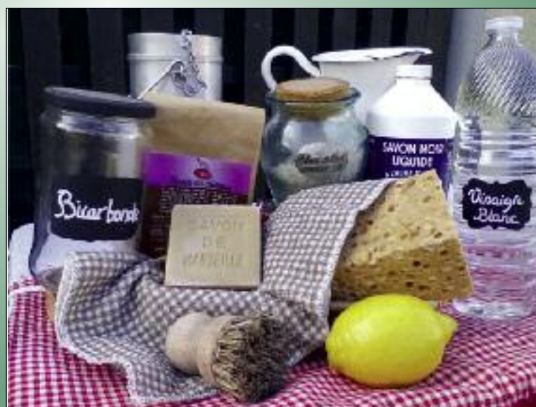
Une fois écartés les produits chimiques, polluants et dangereux, le consommateur peut choisir des produits réellement écologiques, (voir labels ci-contre), ou utiliser les "trucs de grand-mère".

Le label Ecocert est l'un des plus fiables. Exigeant, il s'inscrit dans une démarche globale.