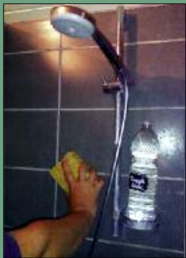
Dénigrée dans les publicités, l'huile de coude reste l'un des ingrédients les plus écologiques.

Pour aller plus loin, voir encadré, en bas de page 5