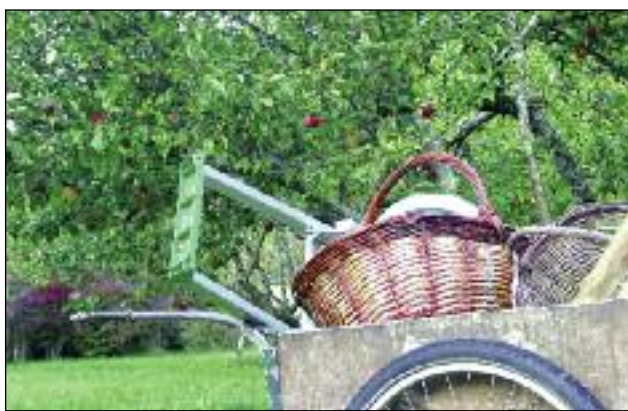
La standardisation a aussi pour effet la perte des savoirs... Les communes sont désormais nombreuses à se mobiliser.