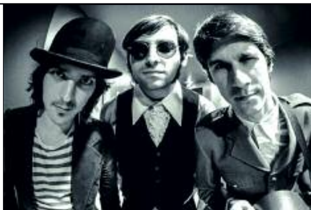
Le groupe toulousain I Me Mine, du nom d'un album des Fab Four

Samedi 17 octobre en ouverture, à 21 h au Cotton Club, rendez-vous avec la pop planante du groupe niçois Alpes. Puis il faudra attendre lundi 19 pour apprécier au Mix Cité l'électro pop plus sombre du lyonnais Paco del Rosso, membre unique de Sin Tiempo. Deux concerts par soir à partir du 20, et ce sera dès 20h30. Mardi, le Bougnat des Pouilles vibrera brit pop et brit rock . Style Beatles, dopés à l'électro psyché, avec le groupe toulousain I Me Mine, puis tendance Rolling Stones et la voix éraillée des mulhousiens de Last Train. Mercredi 21 sera plus calme aux Crieurs de vin. Une première balade nous conduira dans l'univers teinté du folk intemporel de Baptiste W Hamon, talent de la chanson réaliste, puis nous emmènera sur les chemins de l'électro pop minimaliste du nantais Romain Lallement, alias Len Parrot. Au Dixi